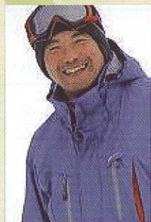
プロスキーヤー・登山家 三浦 豪太 (みうら ごうた)