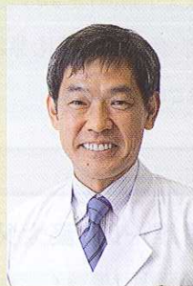
順天堂大学大学院 教授 白澤 卓二 (しらさわ たくじ)

1932年青森県生まれ。1964年イタリア・キロメーターランセに日本人として初めて参加、時速172.084キロの当時の世界新記録樹立。1966年富士山直滑降。1970年エベレスト・サウスコル8,000m世界最高地点スキー滑降(ギネスブック掲載)を成し遂げ、その記録映画「THE MAN WHO SKIED DOWN EVEREST」はアカデミー賞を受賞。1985年世界七大陸最高峰のスキー滑降を完全達成。2003年次男(豪太)とともにエベレスト登頂、当時の世界最高年齢登頂記録(70歳7ヶ月)樹立(ギネス掲載)。アドベンチャー・スキーヤーとしてだけでなく、行動する知性人として国際的に活躍中。記録映画、写真集、著書多数。